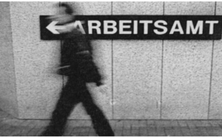
Obwohl in den letzten Jahren zusätzliche Lehrstellen geschaffen wurden, fehlen in der Schweiz immer noch Tausende von Ausbildungsplätzen.

3500 Jugendliche zwischen 16 und 24 Jahren sind im Kanton Bern auf der Suche nach einer Lehrstelle oder einer Arbeit. Immer mehr Jugendliche machen heute sehr jung die fatale Erfahrung vom Arbeitsmarkt ausgeschlossen zu werden. Obwohl in den letzten Jahren zusätzliche Lehrstellen geschaffen wurden und die Konjunktur leicht angezogen hat, fehlen in der Schweiz immer noch Tausende von Ausbildungsplätzen und Arbeitsstellen für Jugendliche. Die Jugendarbeitslosigkeit hat sich in der Schweiz seit 1999 verdreifacht. Wir stehen also vor einem strukturellen Problem: Die Wirtschaft drückt sich immer noch davor, ihre Verantwortung wahrzunehmen und genügend Ausbildungsplätze zu schaffen. Damit brechen die Arbeitgeber laufend ihre Versprechen, die sie vor der Abstimmung über die Lehrstellen-Initiative lipa im Sommer 2003 abgegeben hatten.