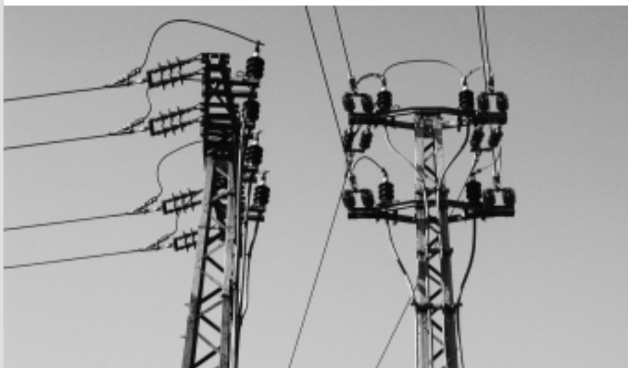
Auswirkungen der internationalen Marktöffnung werden auch in der Schweiz spürbar – zum Beispiel an der zukünftigen Strommarktversorgung.

Im letzten Jahrzehnt sind die Begriffe Globalisierung und Marktöffnung von Berlin bis Madrid bis weit in regierende Linke hinein zu Synonymen für Fortschritt und Moderne geworden und werden als Voraussetzung für weltweite Prosperität gepriesen. Hinweggefegt sind die Strategien der «Blockfreien» der 70er Jahre, welche eine nationale Industrialisierung mittels einem gemässigten Protektionismus und Zollschutzmauern fördern wollten.