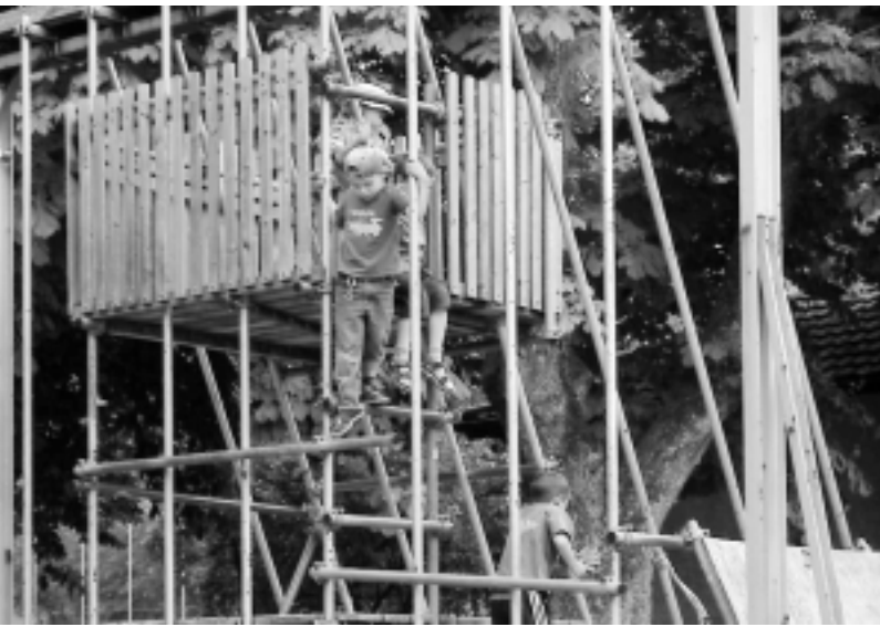
In integrativen Schulen werden die individuellen Begabungen der Kinder erkannt und umfassend gefördert.

Seit Jahren engagieren wir uns für eine Bildungspolitik, welche die Begabungen und Fähigkeiten eines jeden Kindes fördert und allen unabhängig von ihrer Herkunft gleiche Chancen gibt. Bereits 2001 hat der Grosse Rat grünes Licht für die Aufnahme von Kindern mit besonderen Bedürfnissen in die Regelklassen gegeben. Mit der Umsetzung hapert es aber. Erst im Januar 2007 wird der Grosse Rat das von der Erziehungsdirektion erarbeitete Detailkonzept beraten. Das Grüne Bündnis will nun mit einer Website, einem Prospekt und zwei Veranstaltungen dazu beitragen, dieses wichtige bildungspolitische Projekt voranzubringen.