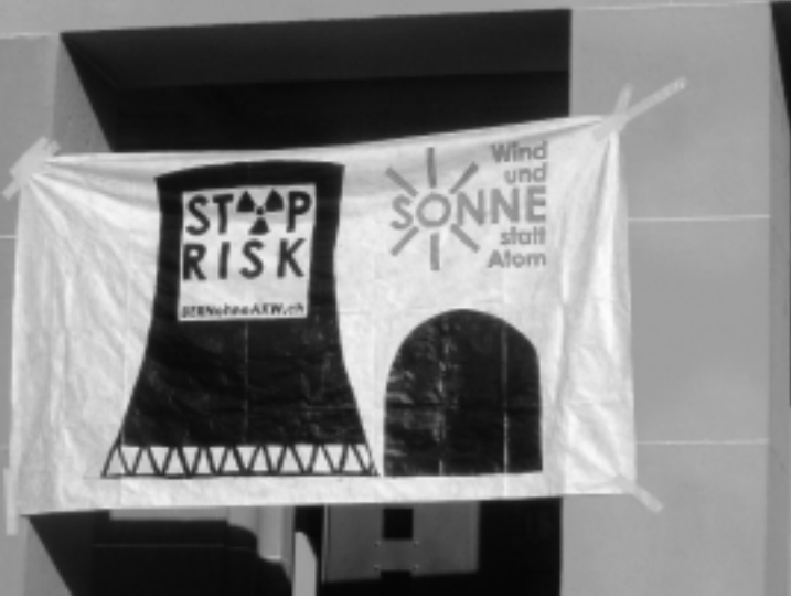
Bern strahlt auf positive Art: Die rot-grüne Regierung will den Ausstieg aus der Atomenergie.

Nach der Ölkrise von 1973 wollte auch die Schweiz ihre Energieversorgung breiter abstützen. Schon damals sprachen alle von erneuerbaren Energieträgern wie Sonne, Wind, Biomasse, Geothermie. Später war Energieeffizienz ein Modewort. Doch in über 30 Jahren kamen wir leider nicht sehr viel weiter. Wenn man die Wasserkraft ausnimmt, dann machen die erneuerbaren Energieträger heute knapp 4% der gesamten Produktion aus. Gegen 60% unseres Energieverbrauchs basiert weiterhin auf Erdöl. Die Stromlobby liess das 10-jährige Atommoratorium in den neunziger Jahren ungenutzt verstreichen. Statt in innovative Technologien zu investieren, überbrückte man die Zeit mit Atomstrom aus Frankreich.