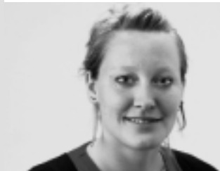
Aline Trede (neu), 1983, junge grüne, Vizepräsidentin Grüne Schweiz, Kampagnenleiterin VCS Schweiz