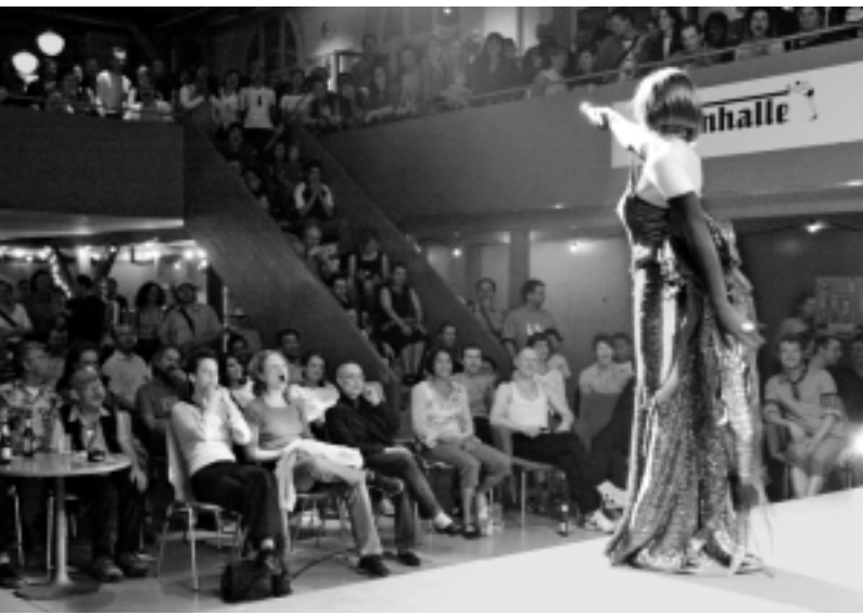
Der PROGR hat sich in letzter Zeit mit einem vielfältigen Angebot einen Namen gemacht.

Seit 2004 wird das ehemalige Progymnasium am Waisenhausplatz von Kulturschaffenden genutzt. Es entstand ein lebendiger Veranstaltungs- und Produktionsort: Die Konzerte in der Turnhalle sowie die Ausstellungen sind beliebt, in den weiteren Räumlichkeiten sind zahlreiche Ateliers untergebracht, die rund 150 KünstlerInnen gute Arbeitsbedingungen bieten. Der zentral gelegene PROGR trägt zur Belebung der oberen Altstadt und zu einer besseren Integration der Kunst im Stadtag bei. Die Bereitstellung von günstigen Ateliers ist zudem eine gute Massnahme zur Kulturförderung. Es war immer ein klares Anliegen des Grünen Bündnis, dass das Zentrum für Kulturproduktion weiterzuführen ist – allenfalls an einem Ersatzstandort.